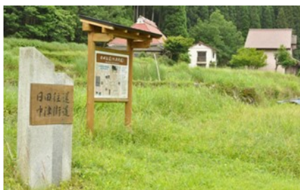
日田往還中津街道