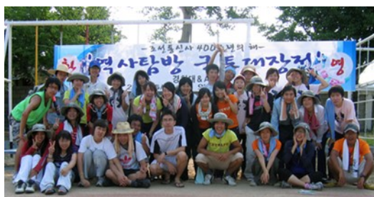
高麗大学校とのフィールドワークの様子