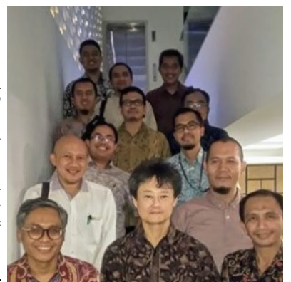
イスラム経済大学及び 大蔵省関係者とともに

イスラム金融では、利益も損失も投資家全員でシェアすることが基本原則となっています。投資が成功し利益を上げた場合、投資家全員でそれを分け合い、投資がうまくいかなかった場合は、損失を投資家全員で分担することが原則です。この原則から、イスラム金融では、一定の「金利」を契約し、予め投資家の取り分を決めることが戒められています。利子（リバ [Riba]）を取ってはいけないという原則です。イスラム経済では、ビジネス、特に貿易・交易から収益を追求することは推奨されていますが、「金利」という形で収益を分配することができないため、「売買からの収益」という形で収益が分配されます。イスラム金融は、通常の金融で扱われている「割賦販売」や「リース」のような「モノ」を媒介とした金融が中心となっているところに特徴があります。