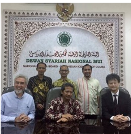
シャリア（イスラム法）遵守を指導する 国家シャリアボードにて

また、イスラム金融には、過度な不確実性（ガラール [Gharar]）が伴う取引はしてはいけないという原則があります。ビジネスには、多かれ少なかれリスクや不確実性が伴いますので、この原則の適用を巡っては議論があります。一方で、昨今、金融商品の中身が複雑なものとなり、内在するリスクが投資家にとってよくわからない商品も開発されています。2007年に起きた米国のサブプライムローン危機（リーマンショック）も、複雑な証券化スキームにより、内在するリスクがわからないまま、住宅貸付証券に過大な投資が集中したことがその原因となっています。内在するリスクがよくわからない金融取引に対して、イスラム金融は慎重な態度を維持しています。実際、イスラム銀行が被ったリーマンショックの影響は軽微なものでした。金融危機を国際的に広げないための防波堤の役割をイスラム金融が担っているところがあり、そうした役割を国際金融制度に組み込むことを考えています。