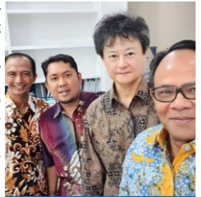
イスラム国際大学学長とともに

サミュエル・ハンチントン (Samuel Huntington) 教授は、ロングセラーであるその著作「文明の衝突」で、1990年以降の世界を九つの「文明」に分け、日本（日本文明）をそのうちの一つのユニークな文明と分類しています。この著作の衝撃的なところは、今後、西洋文明（米国）、中国文明、そしてイスラム文明が相互に衝突することは避けられず、日本はその衝突の中で、右往左往させられる運命にあると予測されているところです。私は、この「文明の衝突」論から、これからの国際金融制度のあり方を考え、日本の立ち位置を見定めたいと考えています。日本の金融システムから始め、米国金融システム、中国金融システム、そしてイスラム金融システムの制度的特徴を比較し、それぞれの金融システムが、その特徴を活かしつつ調和・共存する（衝突を回避する）ためにはどうすればいいのかを研究しています。最近では、今後、世界の人口の4分の1を占めるようになっていわれているイスラム教徒が、イスラム教の教えに則って取引できる金融、すなわち、イスラム金融を主に研究しています。