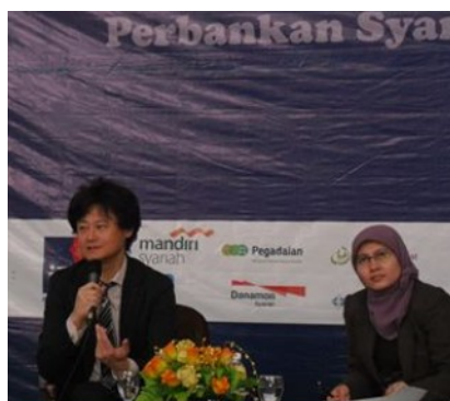
イスラム国際大学新学部長とともに