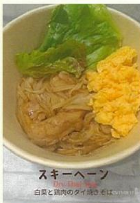
スキーヘーン Dry Duck 白菜と鶏肉のタイ焼きそば