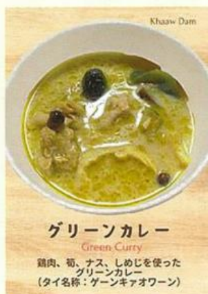
グリーンカレー Green Curry 鶏肉、筍、ナス、しめじを使った グリーンカレー (タイ名称：グーンキャオワーン)