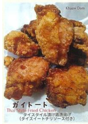
ガイトート Thai Style Fried Chicken タイスタイル漬け鶏唐揚げ (タイスイートチリソース付き)