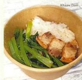
パットパック Thai Style Stir Fried Komatsunae タイで日本人も好んで食べる空心菜炒め (パックブーンファイデーン)の小松菜 バージョン