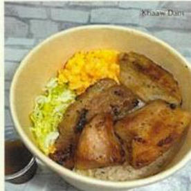
コムーヤーン Grilled Pork Neck 豚トロ肉のタイスタイル漬け焼 (タマリンドソース付き)