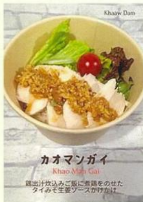
カオマンガイ Khao Man Gai 鶏出汁炊込みご飯に煮鶏をのせた タイみそ生薑ソースかけかけ