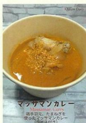
マッサマンカレー Massaman Curry 鶏手羽元、たまねぎを 使ったマッサマンカレー (ライス付き)