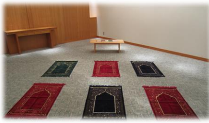
お祈り部屋(宴会場小部屋)