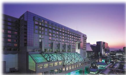
ホテルグランヴィア京都