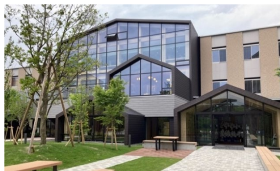
APU 構内・教学棟「グリーンcommons」