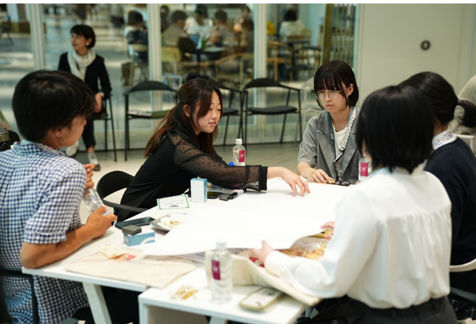
テーマについて議論し、発表内容をまとめる 高校生副学長（左から2番目）とサミットメンバー