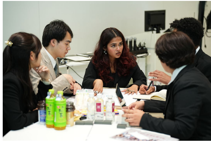
テーマについて議論する在校生副学長（写真中）とサミットメンバー