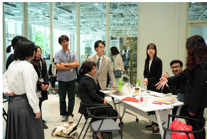
発表の順番や、流れを一緒に確認する特命副学長とサミットメンバー