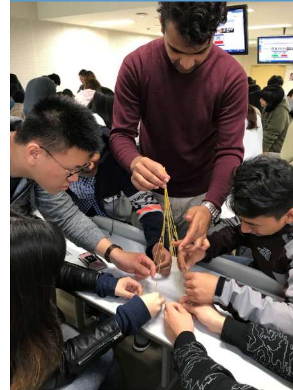
(マシュマロチャレンジ)

大学では学生が ターゲットなので 学生の声に耳を 傾けることが大事 だと思っています。