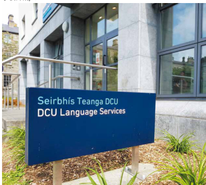
学校外観/イメージ