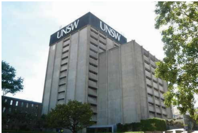
学校外観/イメージ