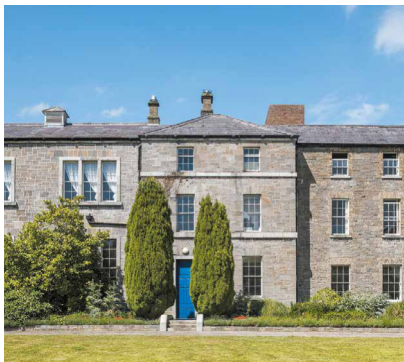
学校外観/イメージ

Dublin City University, Language Services