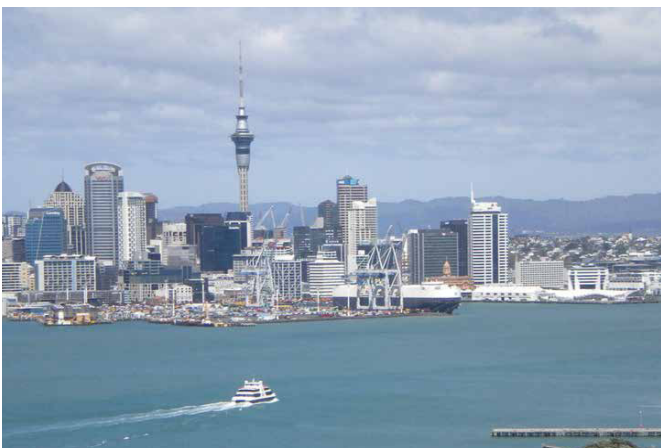
オークランドの街並み/イメージ

Auckland University of Technology, International House