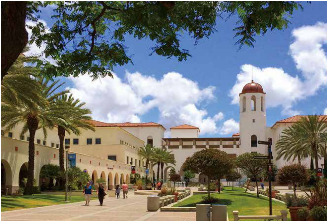
キャンパス/イメージ