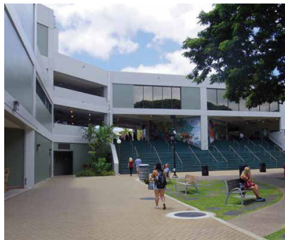
キャンパス/イメージ