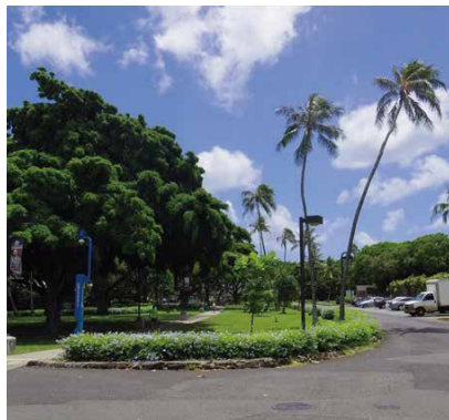
キャンパス/イメージ

University of Hawaii at Manoa, Outreach College, English Language Programs